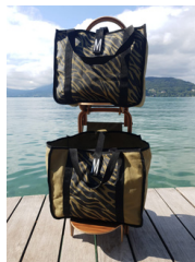
Ref : VNOKZ Caddy, deux sacs kaki zébré et une housse