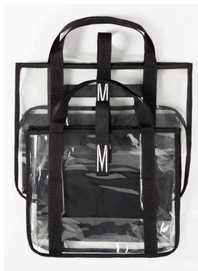
Ref : SLOPV Cristal transparent PVC