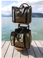
Ref : VNOKU Caddy, deux sacs kaki uni et une housse