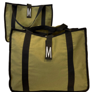
Ref : SLOKU Coton kaki uni