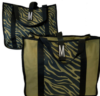
Ref : SLOKZ Coton kaki zébré